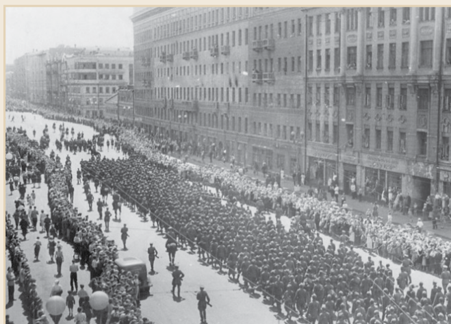
Колонна военнопленных проходит по улице Горького

В этой ситуации приходилось либо отправляться на поиски продуктов в Подмоскovie, либо покупать их по завышенным ценам на колхозных рынках. Чтобы меньше зависеть от колхозников, поздней весной 1942 года москвичи взялись за лопаты и грабли. Под огороды использовались все доступные клочки земли, выделялись участки даже на кладбищах.