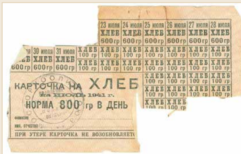
Хлебная карточка, лето 1941 года

17 октября 1942 года, когда немецкие войска были отброшены на достаточно большое расстояние от столицы, в Москве на главных магистралях разрешили маскировочное освещение.